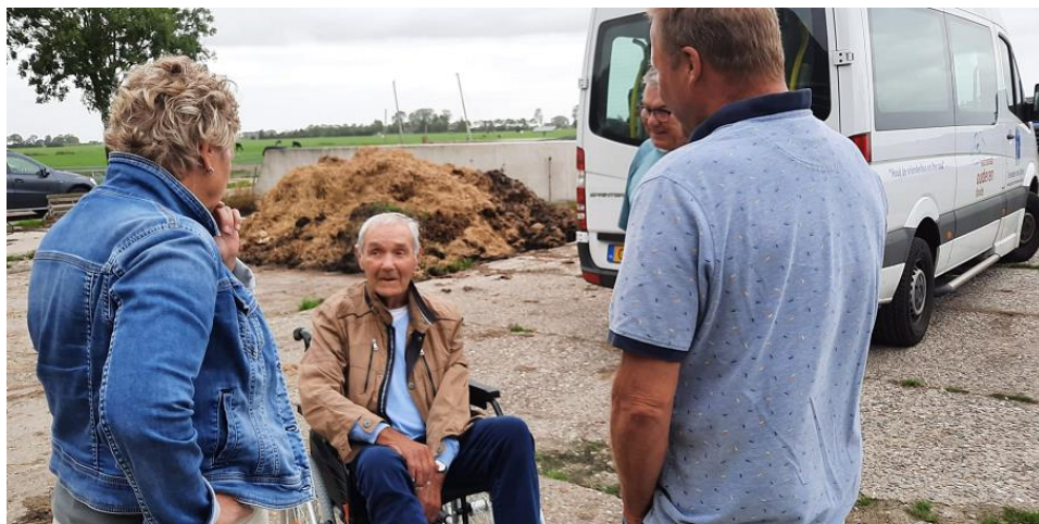
Feest van herkenning op de boerderij van een vroegere veehandelaar