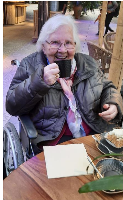
Naar de Orchideeënhoeve – een feestdag voor een 102 jarige

Het team van vrijwillige chauffeurs en begeleiders is onmisbaar voor de Vriendenbus. Deze mensen zetten zich met veel enthousiasme in voor de bewoners en hun familie. Er worden foto's gemaakt van de uitstapjes. De begeleider stuurt deze na afloop met een verslag naar de coördinatoren. Zij zorgen ervoor dat deze bij de familie en woonafdeling terechtkomen.