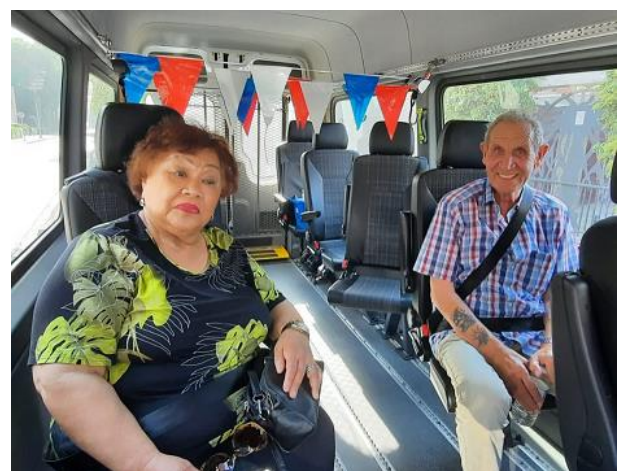
Een verjaardagsuitstapje naar Giethoorn