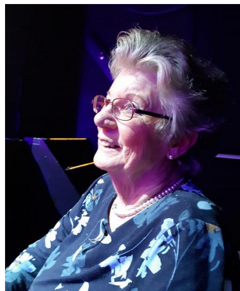
Aandachtig luisteren op het Elvis concert