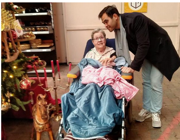
Met oma naar de Kerstmarkt

We hebben op diverse locaties familieavonden bijgewoond en het verhaal van de Vriendenbus verteld. Ook op deze wijze wordt er meer bekendheid gegeven aan de Vriendenbus.