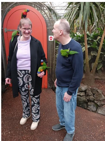
Samen naar de Orchideeënhoef